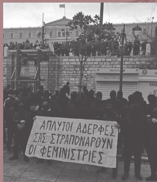
από το συλλαλητήριο ενάντια στο ν/σ Αθήνα, 11/2/24