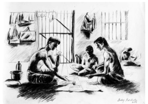
Από τη συλλογή ποιημάτων "Εγκλειστές Συναντήσεις" (2008), με ποιήματα εγκλειστών νέων στη δικαστική φυλακή ανηλίκων Διαβατών

Λογαριάζοντας τη ζωή Στο σημάδι ξέφυγα Σταμάτησα σε στιγμές απόλαυσης Της ακοής το σκοτάδι με συντάραξε Το απόλυτο τίποτα Παράκουσα στης ακοής το θέλημα Δεν είναι όπως τα σχεδιάζουμε Α! το παράπονο Το βάσανο Η ζωή Η ελευθερία